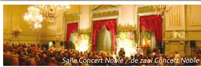
Salle Concert Noble / de zaal Concert Noble

Il créa des hôtels de maître tels celui du Comte de Mérode rue aux Laines, des maisons privées dans le quartier de la place Royale, la salle dite du « Concert Noble » à Bruxelles, le Palais abbatial de Tournai, devenu l'Hôtel de Ville et bien d'autres bâtiments encore !