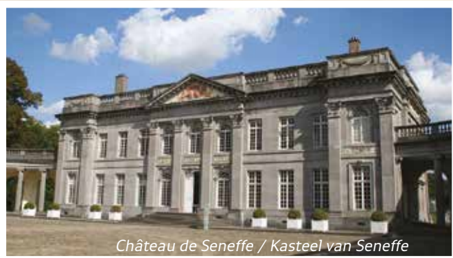
Château de Senefve / Kasteel van Senefve