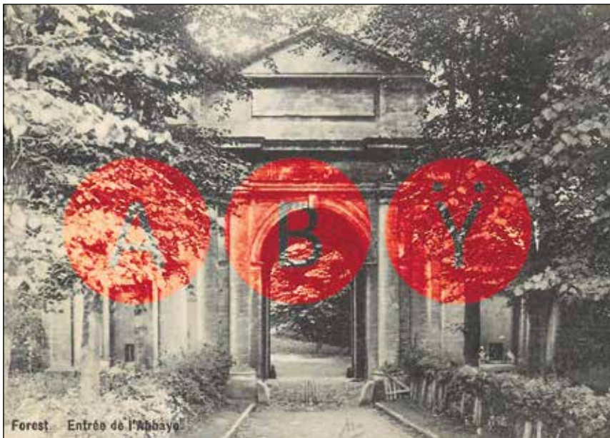
Forest. Entrée de l'Abbaye

UN PÔLE CULTUREL À L'ABBAYE DE FOREST ?!