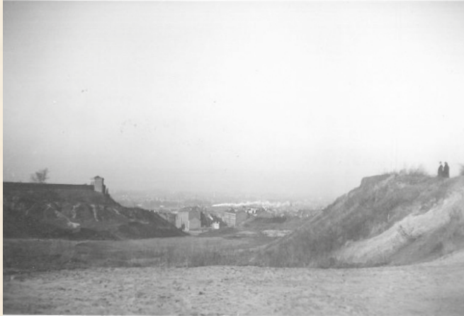
De zandgroeve van Vorst – op 2 december 1939 (links de muur van de vroegere begraafplaats)