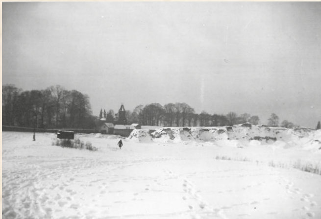
De zandgroeve van Vorst in de sneeuw – op 28 januari 1940 (op de achtergrond het kasteel Fontaine-Vanderstraeten, ook wel "de Wijngaard" genoemd, de huidige Cité Messidor).