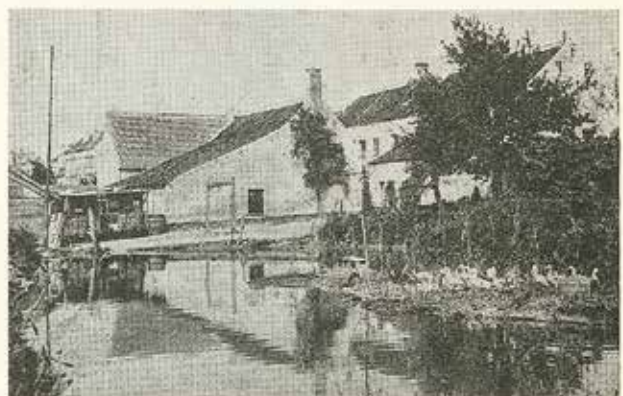
La « Ferme du Lac » en 1905 vue de derrière. Le bâtiment à front de rue est caché par un bouquet d'arbres.