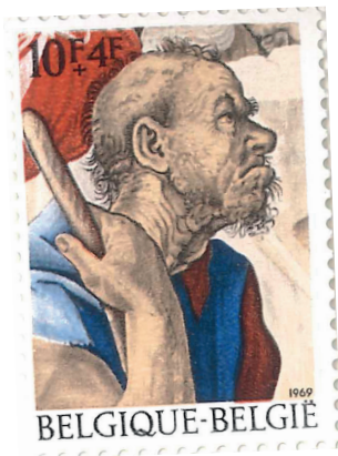
La légende de Notre-Dame du Sablon. Timbres émis pour le millénaire de Bruxelles en 1979