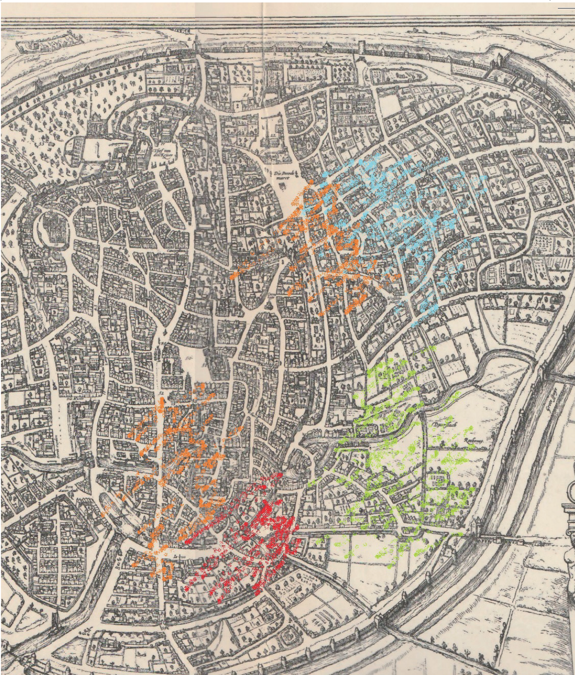
Carte de Bruxelles en 1572. En bleu, les tisserands. En orange, les tapisiers. En vert, les foulons. En rouge, les teinturiers. Kaart van Brussel in 1572. In het blauw, de wevers. In oranje, de tapijtwevers. In het groen, de volders. In het rood, de ververs.