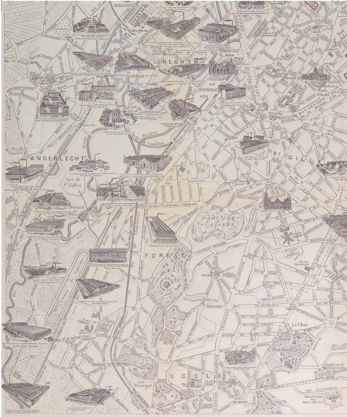
Bruxelles industriel en 1910 Plan dessiné et gravé par A. Verwest, vignettes dessinées par F. Xhardez, gravées par M. Vanderost 1910.